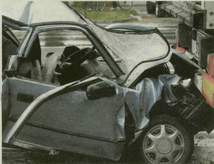
Csoda, hogy élve kerültek ki a totálkáros Suzukiból.

A kórházban egymás után érkeztek hozzá a látogatók, a kollégájuk is bennjárt. A fiatalember azt mondta, jó a sok vendég, elterelik a figyelmét arról, hogy mennyire fáj a lába.