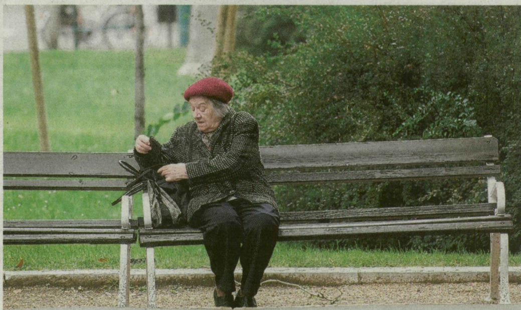
Manapság Pirk-féle padokon pihenhetünk a fák alatt.