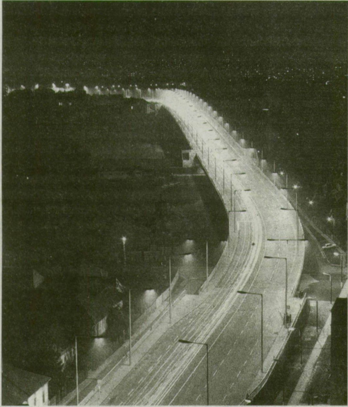
Fényárban úszik a két part között feszülő híd. Megújított és megerősített partfal védi Szegedet a haragos folyótól.