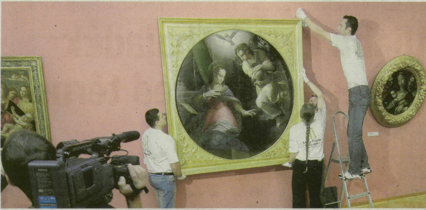
Tegnap sajtótájékoztatót jelentettek be hivatalosan: azonosították az Angyali üdvözlés festőjét. Október 28-tól a Szépművészeti Múzeumban látható, tavasszal tér vissza Szegedre.