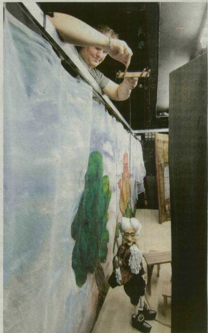
A marionettbáb mozgatója külön művészet. Vigyázni kell arra is, hogy ne gubancolódjanak össze a zsinórok.