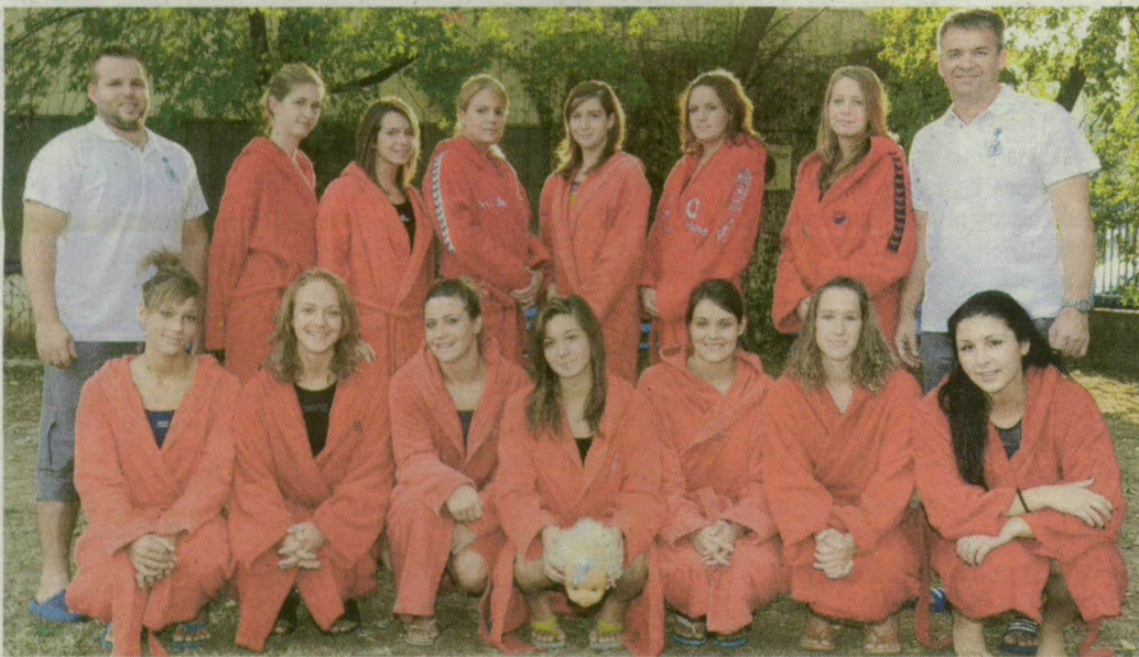
Újoncként sem kell félni az Universitas Szeged csapatát.

Az Universitas Szeged holnap 16.30-kor az újszegedi sportuszodában a címvédő Dunaújváros ellen kezdi meg élvonalbeli szereplését.