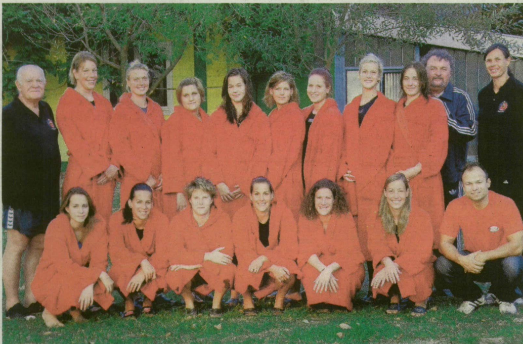
A dobogóra vágyik a világbajnokokkal megerősített Hungerit MetalCom-Szentes.

A felkészülést augusztus 11-én kezdő gárda két előké-