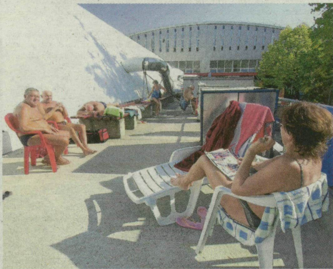
Többen is napoztak tegnap a sportuszodában.

28,5 Celsius-fokot mértek Újpesten tegnap – ezzel a budapesti melegrekord megdőlt. Az eddigi csúcst (27,2 fok) 1942-ben mérték a fővárosban – tájékoztatott az Országos Meteorológiai Szolgálat. Az országos rekord is veszélyben volt: Kiskunhalason 29,7 Celsius-fokot mutatott a hőmérő – ez csak egytized fokkal kevesebb, mint amit 1935-ben Szegeden mérték.