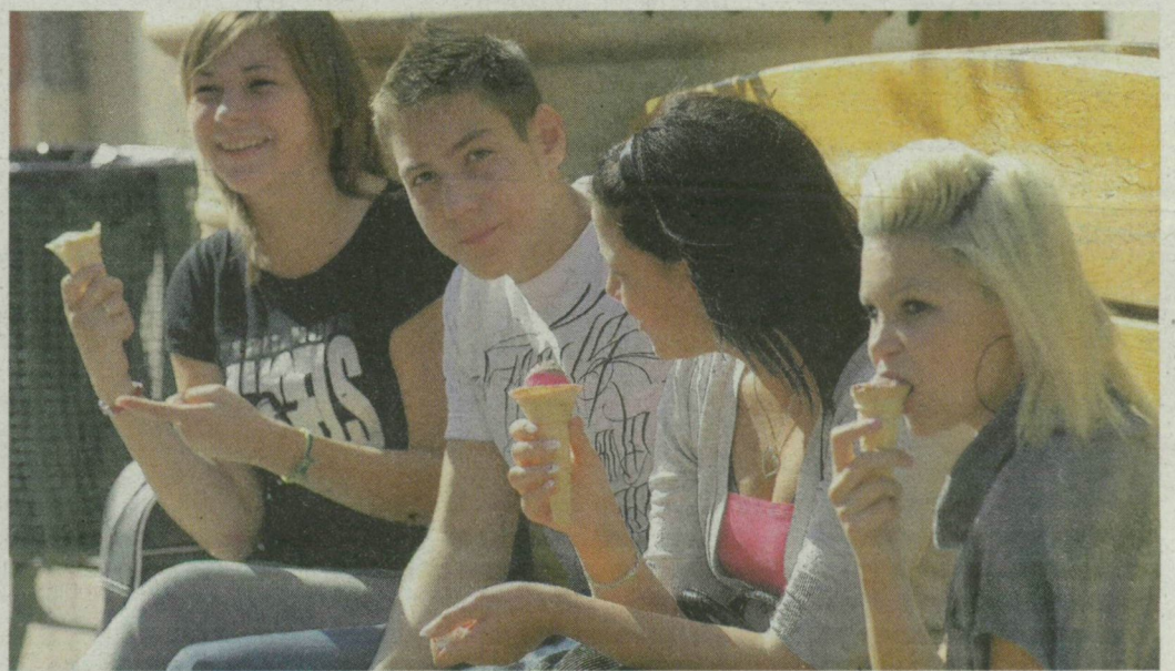
Tegnap a Kárász utcán sokan fagyaltoztak, napfürdőztek a jó időben.