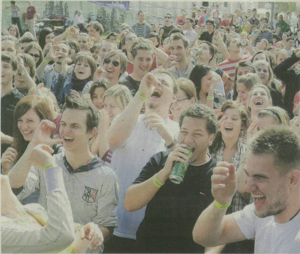
Az ország legvidámabb kara cím a szegedi gazdaságtudományi fakultásé.