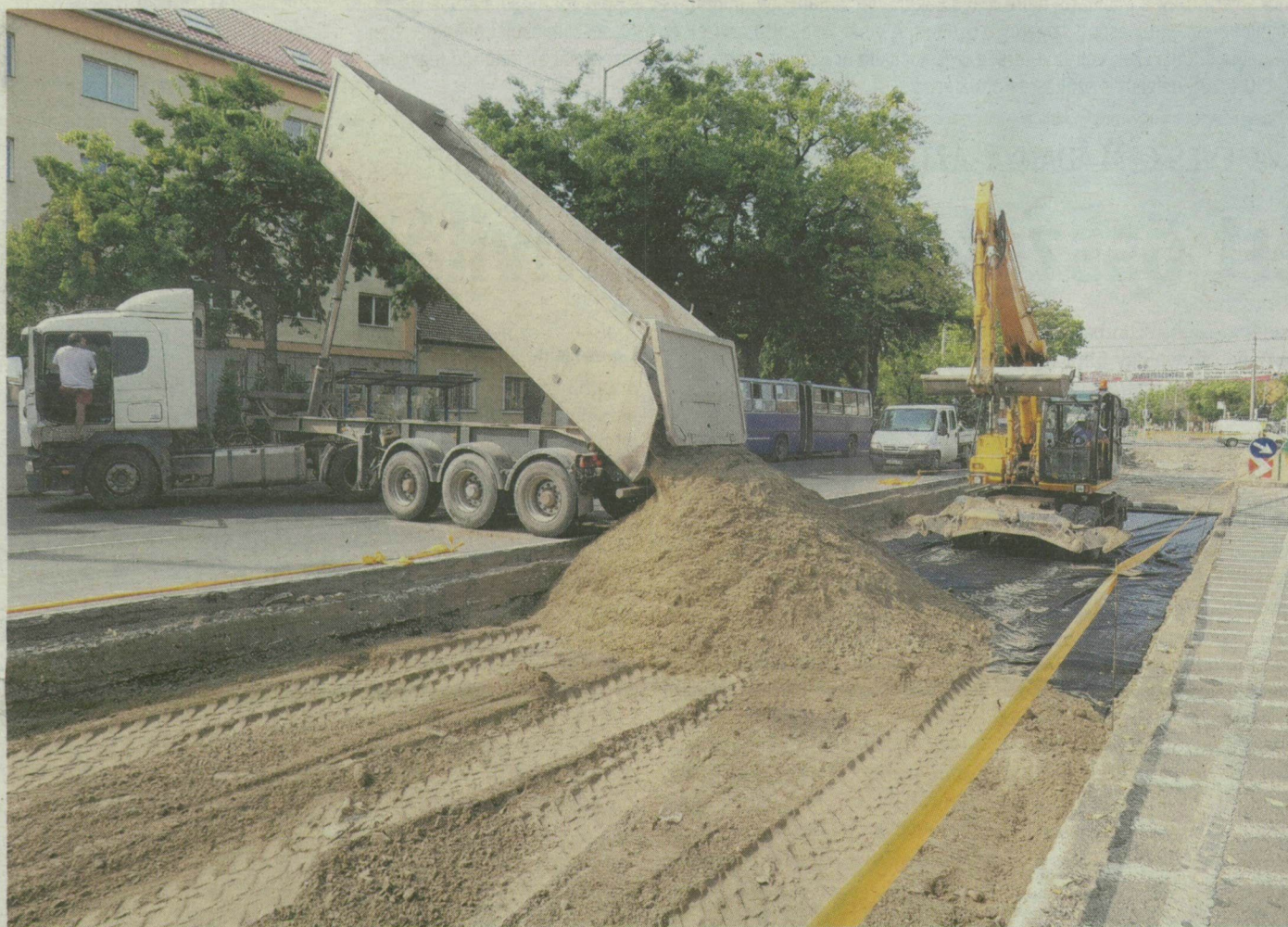
A Kossuth Lajos sugárúti villamosvonal, ahogy eddig nem láthattuk. Az új síneknek mély, masszív alap kell.

SZEGED. Bizonyára a legtöbb arra járó megdöbben, amikor a Kossuth Lajos vagy a Boldogasszony sugárúton a villamossínnek helyén tátongó gödröket látja. Laikusként eszünkbe sem jutna, mennyire mélyen kell kezdeni a munkát ahhoz,