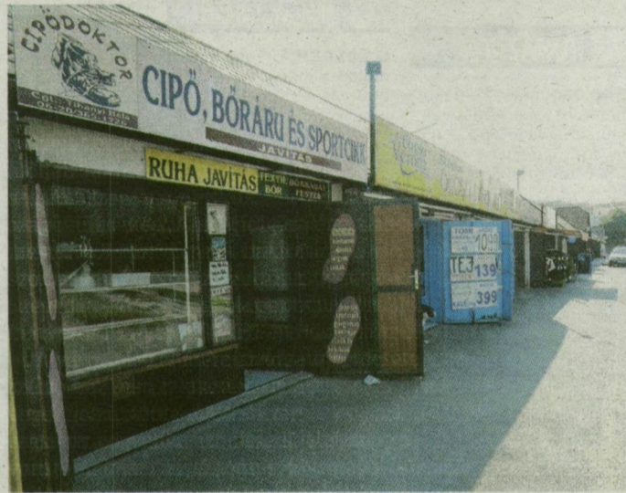
A garázssori tulajdonosok egy részével még nem tudott megegyezni az önkormányzat.

sok esetben igen jelentős költségvonzattal járó átalakításokat – garázsok összevonását, tető átépítését, szükséges berendezések, helyiségek kialakításának biztosítását – saját költségükre valósították meg.” A gazdasági alpolgármester ebben a költségeket szeretné kö-