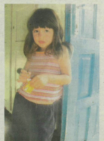
Bot Denisszáék öten élnek 20 négyzetméteren.