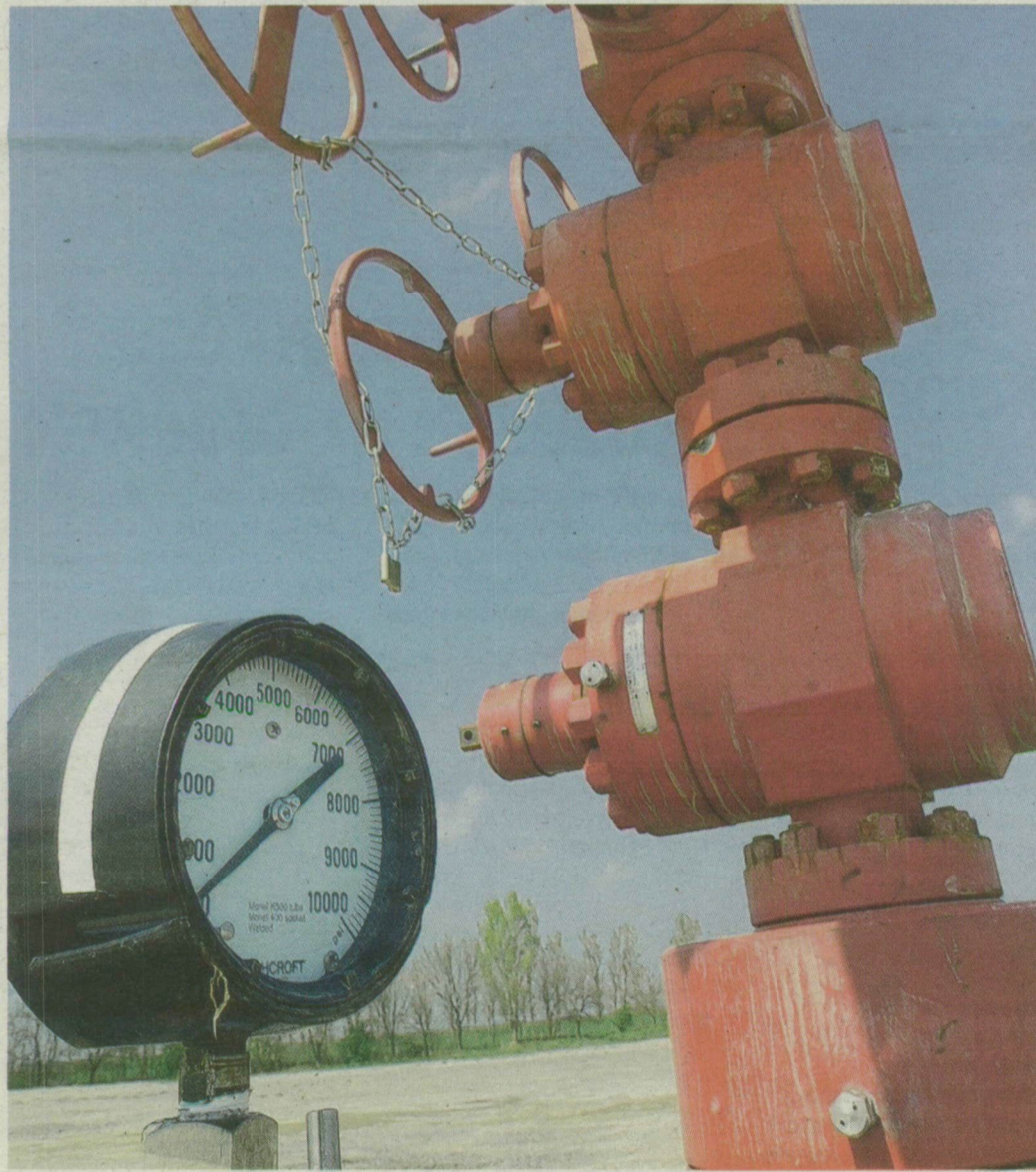
Legkésőbb 2012-ben leveszik a lakatot.

Ismét Óföldéakra figyel a szénhidrogén-bányász szakma és a pénzügy: elkezdődött a kőzetrepesztés a falu alatt több ezer méterrel. Mint kiderült, a kutatást végző cégek egymást se avatják be minden titokba.