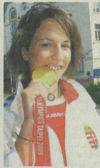
Valódi arany.