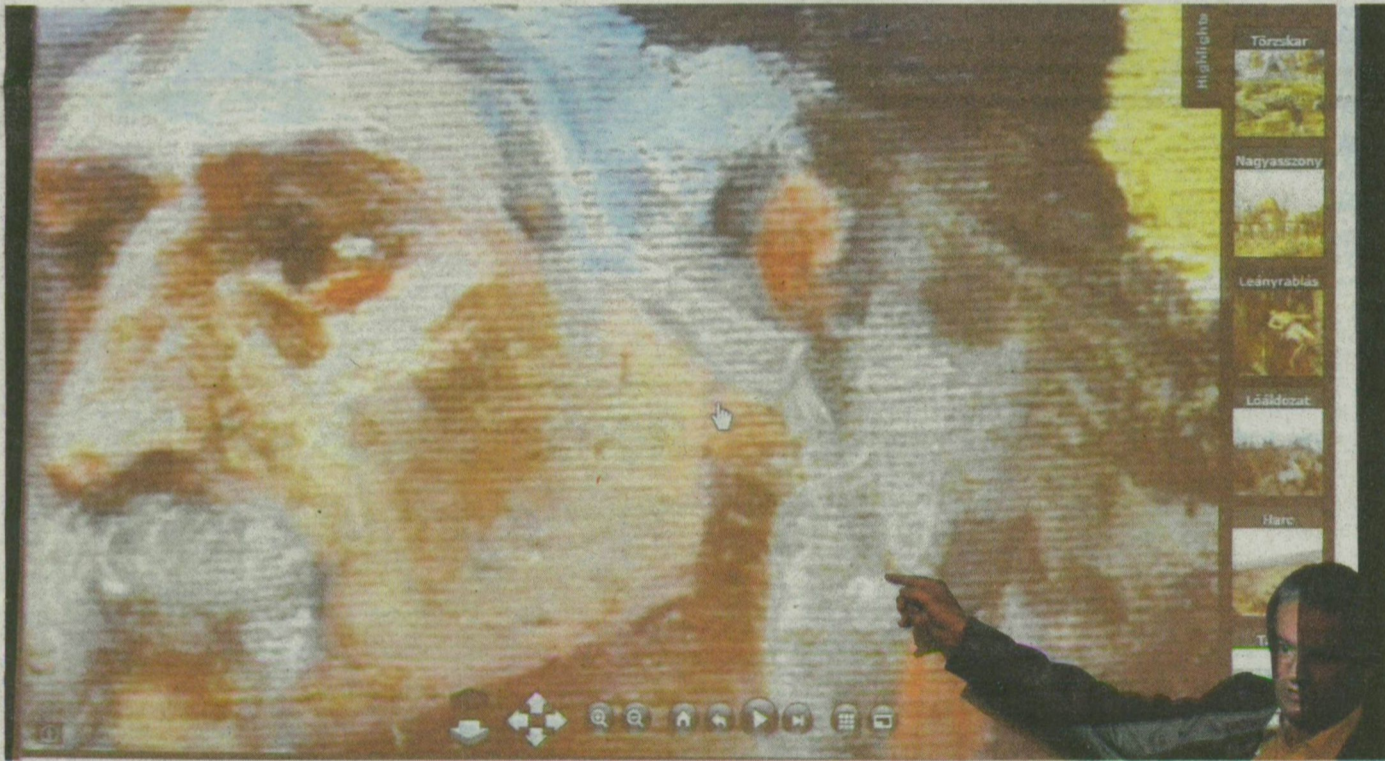
Árpád vezér közelről, nagyban. A Microsoft fejlesztési igazgatója mutatta be „művüket” az újságíróknak.

ÓPUSZTASZER, BUDAPEST. A Microsoft két magyar mérnöke digitalizálta A magyarok bejövetele című képet. Az alkotást eredetileg a budapesti Városli-