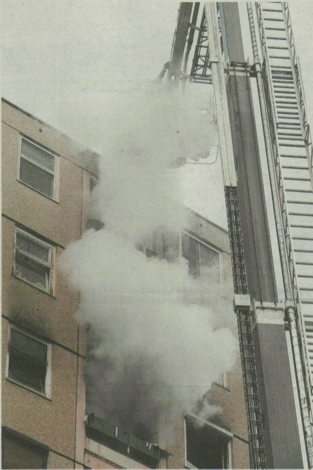
Gyorsan felkészült a füst a nyolcadik emeletről a kilencedikre és a tizedikre. A tűzoltók az „ég felől” látványos munkával fél óra alatt oltották el a tüzet.

26 PERCIG TART A 12 PERCES ÚT A DUGÓK MIATT