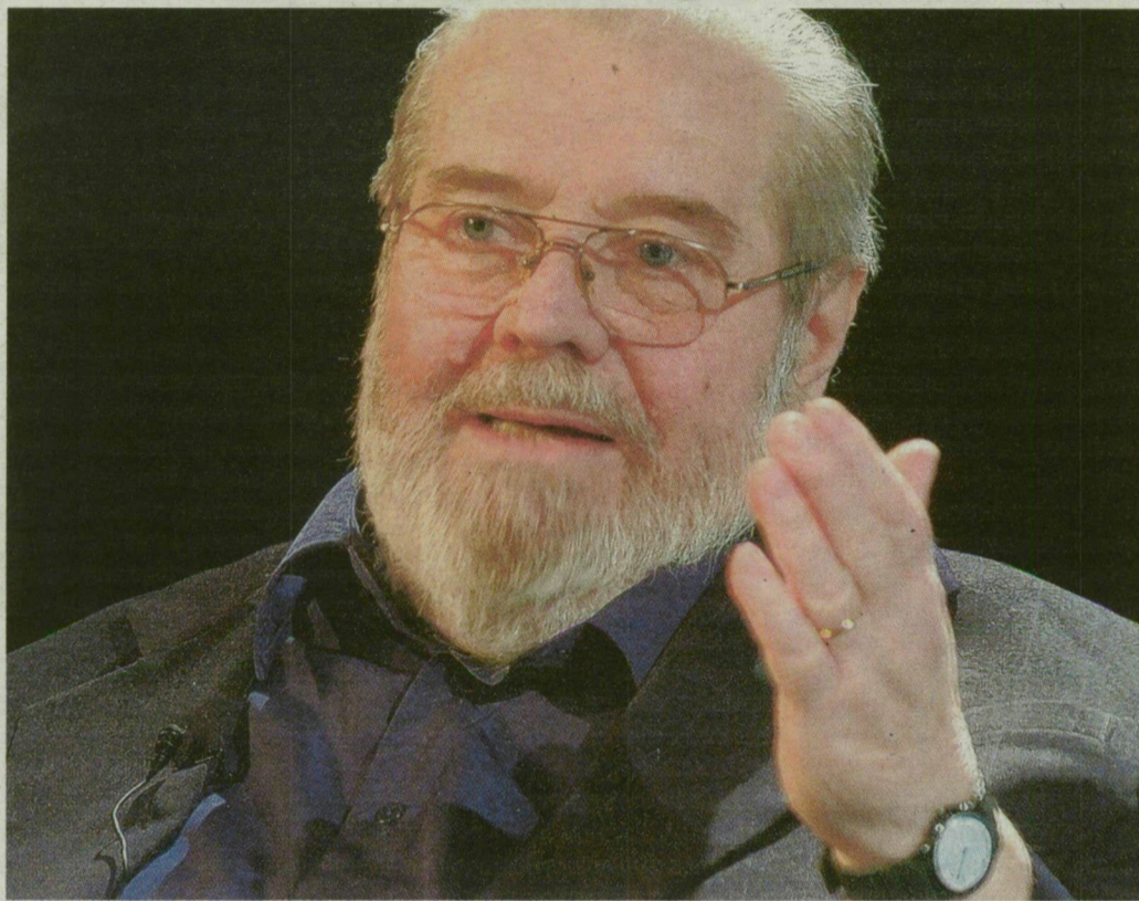
A színészkirály már színpadra lépne.