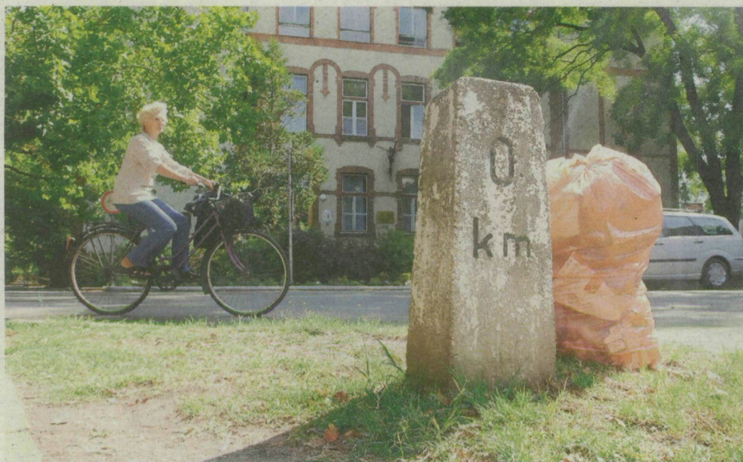
A kilométerkő a zeneiskola közelében. A háború előtt állították.