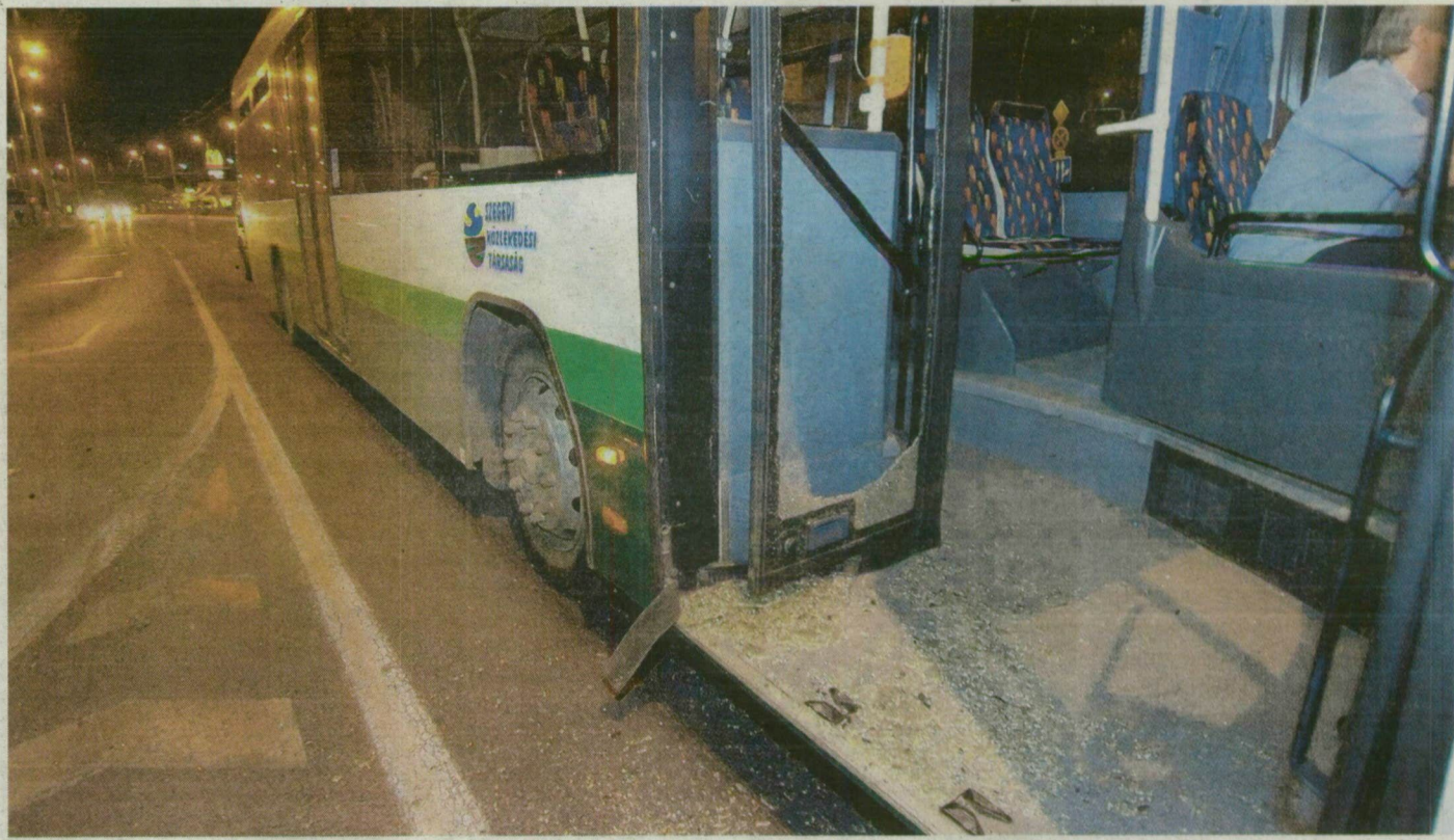
A garázda férfi kiverte az üveget a busz ajtajából. A kár mintegy 200 ezer forintra rúg.

A rendőr időben odaért, a tettest bilincsbe verve elvitték. Elhangzott a helyszínen, hogy ami történt, az garázdaság, és közfeladatot ellátó személy el-