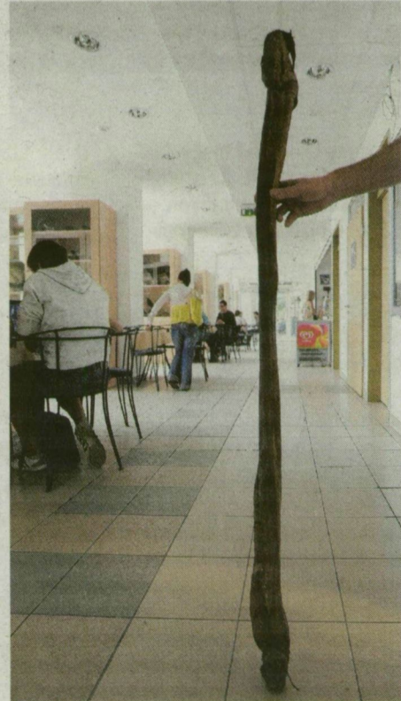
Bálnapénisz-preparátum az egyetemi folyosón.