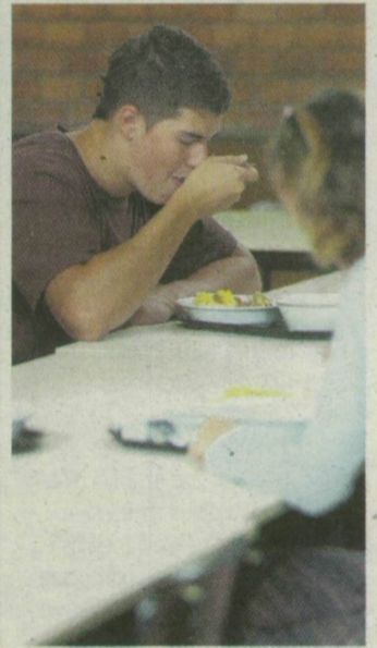
3000 középiskolás eszik a szegedi menzákon.