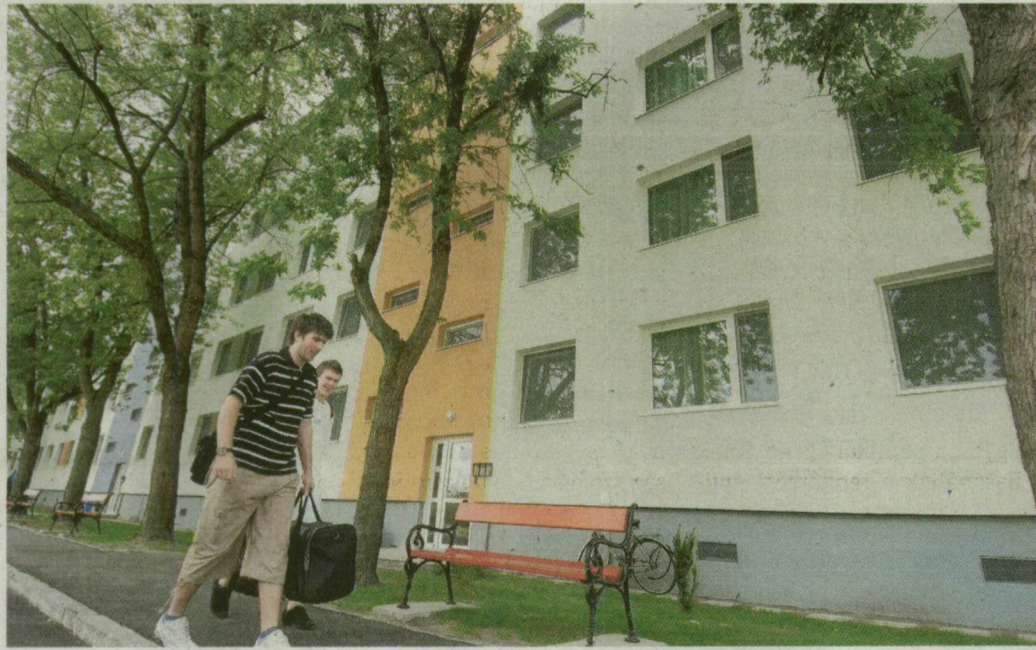
Beköltözhetnek: 60 diáklakást újított fel az SZTE az öthalmi kollégiumban.

is magába fogadó központi egyetemi épület 2,5 milliárd forintos felújítása. A kivitelező a Ferroép Zrt., a munka a tervek szerint egy évig tart, a műszaki átadás várható idő-