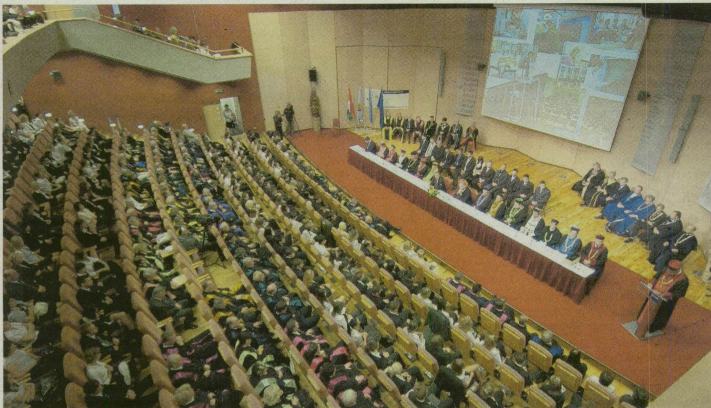
Országos tanévnyitó. Ünnepi öltözetek, ünnepi hangulat, ünnepi mondanivaló a József Attila Tanulmányi és Információs Központban.