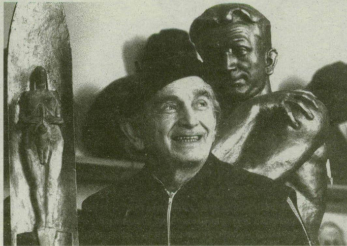
Az alkotó. Tápai, Szeged szobrásza.

ban. Azt írja: „...Beidegzett mozdulatokkal, sikeres kalapácsütésekkel fejlesztettem tovább Madách vonásait, hogy a Madách Imre Általános Iskola 100. évfordulójára készítsék az iskola tanulóinak egy iskolájuk stílusába illő szép, hiteles Madách-fejet.”