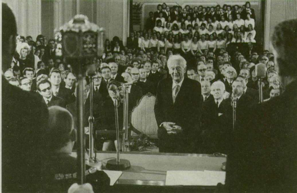
A Nobel-díjas Szent-Györgyi. Másodszor is díszdoktorrá fogadják.