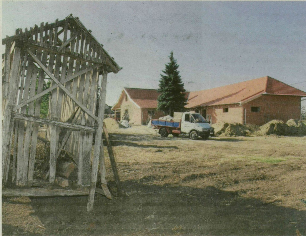
A bankár nagypája két kezével építette a család tanyáját. Most felújítják.

A felújítást unokatestvére felügyeli, azonban háromhete óta maga is igyekszik leutazni Kakasszékra. A decemberben elkészülő ház nemcsak a családjának – így lányainak, a 14 éves Lillának, a