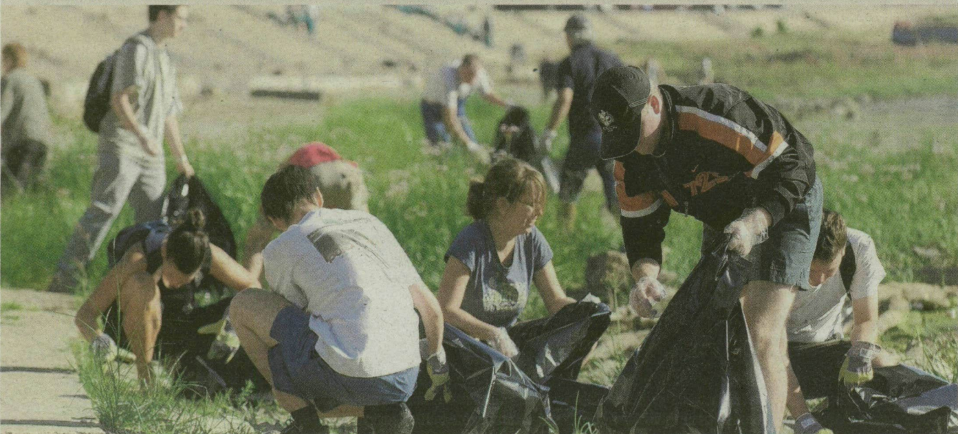
Mintegy ötvenen szedték a szemetet tegnap a delmagyar.hu által is támogatott Tiszta Tisza-partot! elnevezésű takarítási akció keretében Szegeden, a folyó belvárosi szakaszán. Az önkéntesek – amint az Segesvári Csaba fotóján is látható – több zsák hulladékot gyűjtöttek össze. Volt, aki szabadnapot vett ki, hogy eljöhessen takarítani. A résztvevők találtak PET-palackokat, csikketeket, fémhulladékokat és nadrágot. Részletek a 3. oldalon