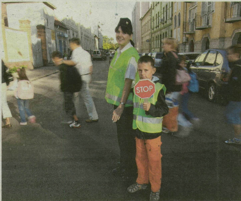
Az elsősök kicsit még álmodoztak tegnap a Dózsa-iskolában. Reggel és délután 61 rendőr, valamint tucatnyi városőr és polgárőr segítette az iskolásokat Szegeden.

SZEGED. 26 ezer diák és 2600 pedagógus kezdte el tegnap a tanévet Szegeden, ahol már a munkakezdés előtt bedugult a nagykörút. Sorok araszoltak fél 8 körül a Felső Tisza-parton, de nem volt sokkal különb a helyzet a Tisza Lajos körúton és a klinikáknál sem. Bár korábban sokan számítottak az egyetemi gyakorló általános iskoláknál,