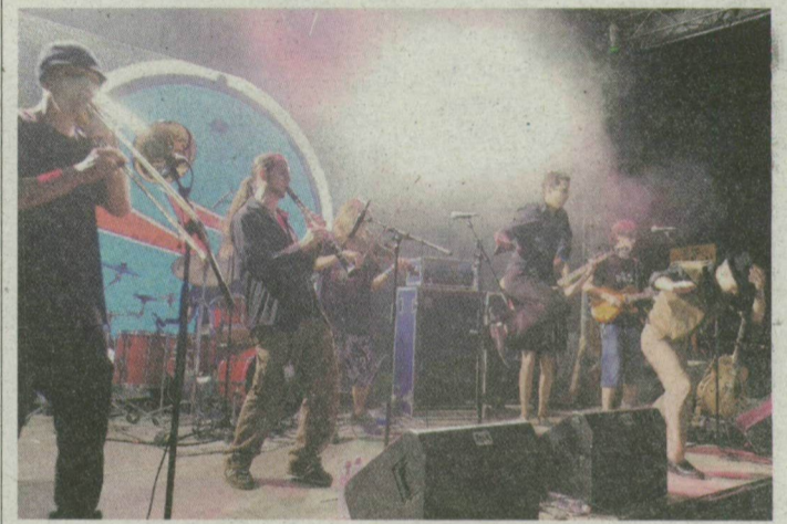
Színpadon a Sheket. Hangosan énekelnek?

SZEGED. Ami a Szegedi Ifjúsági Napok alatt sok helyi lakosnál kiverte a biztosítékot, Tokajban még egyáltalán nem okozott gondot. Idén tizedik alkalommal rendezték meg a Hegyalja Fesztivált, 71 ezer vendéggel, éppúgy a Tisza partján, ahogyanálunk. Az egyik szervező elmondta: náluk soha nem panaszkodtak a hangerő miatt, hi-