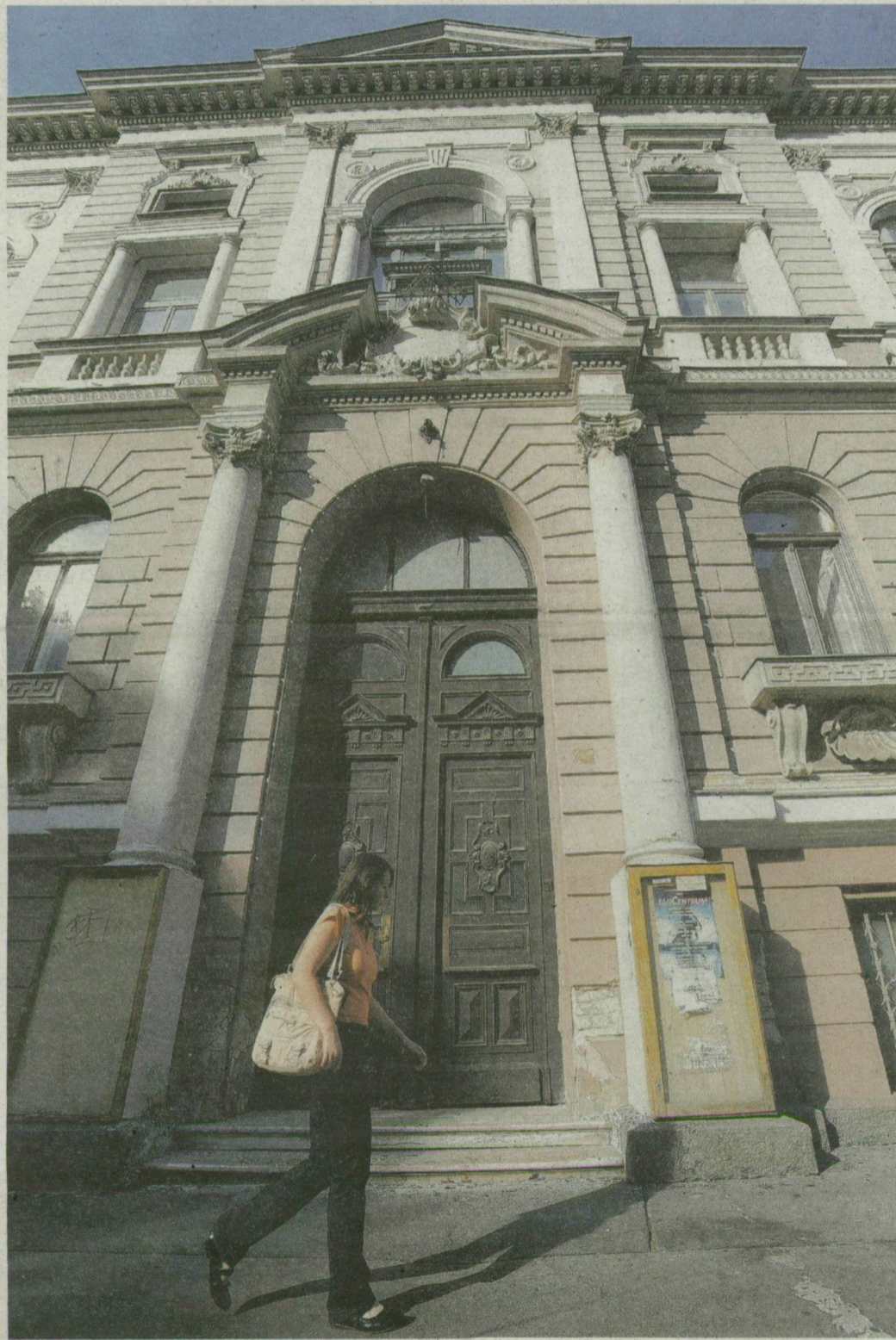
Az impozáns épületbe most csak a takarítók járnak.

Több mint egy éve üresen áll az egykori Bartók művelődési központ épülete Szegeden. A városi ügyészség költözött volna ide, de erre anyagi okokból nem került sor. A mintegy 300 millió forintot érő palota az IKV Zrt. kezelésében van – a legújabb hírek szerint a Szegedi Katonai Ügyészségé lehet.