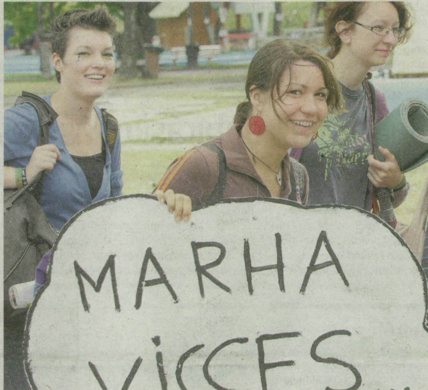
Idén 62 ezren lazultak az újszegedi Partfűrdőn. A vasárnap összecsomagoló fiatalok a rövidebb zárónap ellenére vidáman búcsúztak.

Nézőcsúcsot állított fel a SZIN: öt nap alatt összesen 62 ezren voltak a Partfűrdőn. A sok zajpanasz miatt a szombati programokat átszervezték, és éjfélre elcsendesült a fesztivál. Előző éjjel a nagyszínpadon forgatták a Magic Boys zárójelenetét.