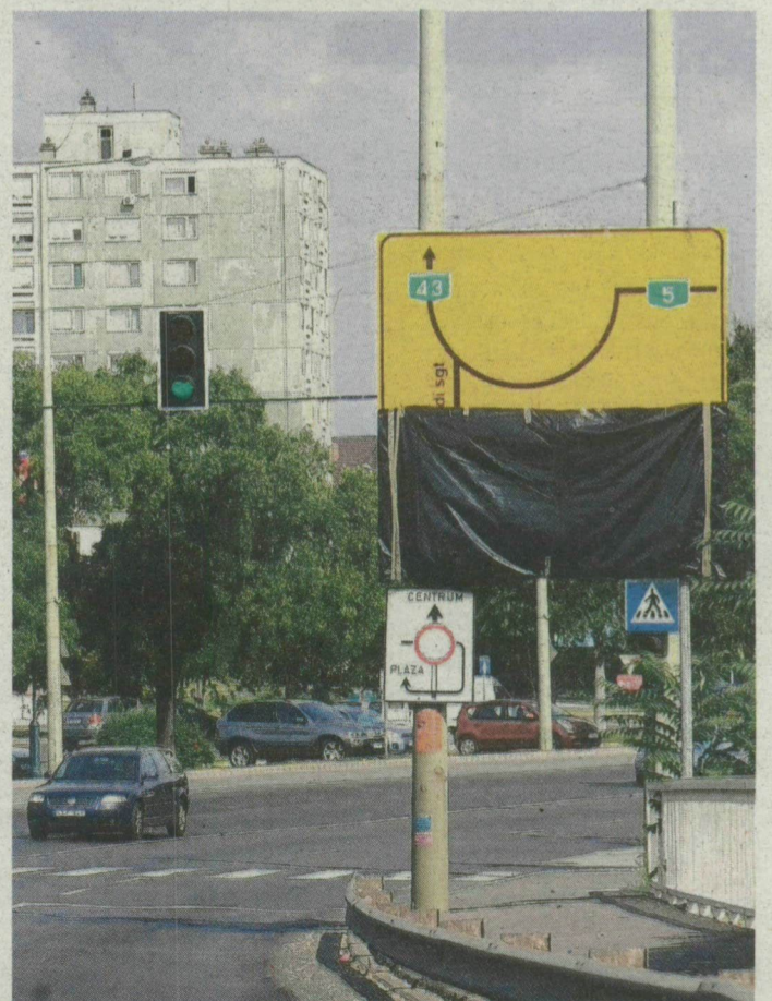
A forgalmi változásokat mutatja a tábla.