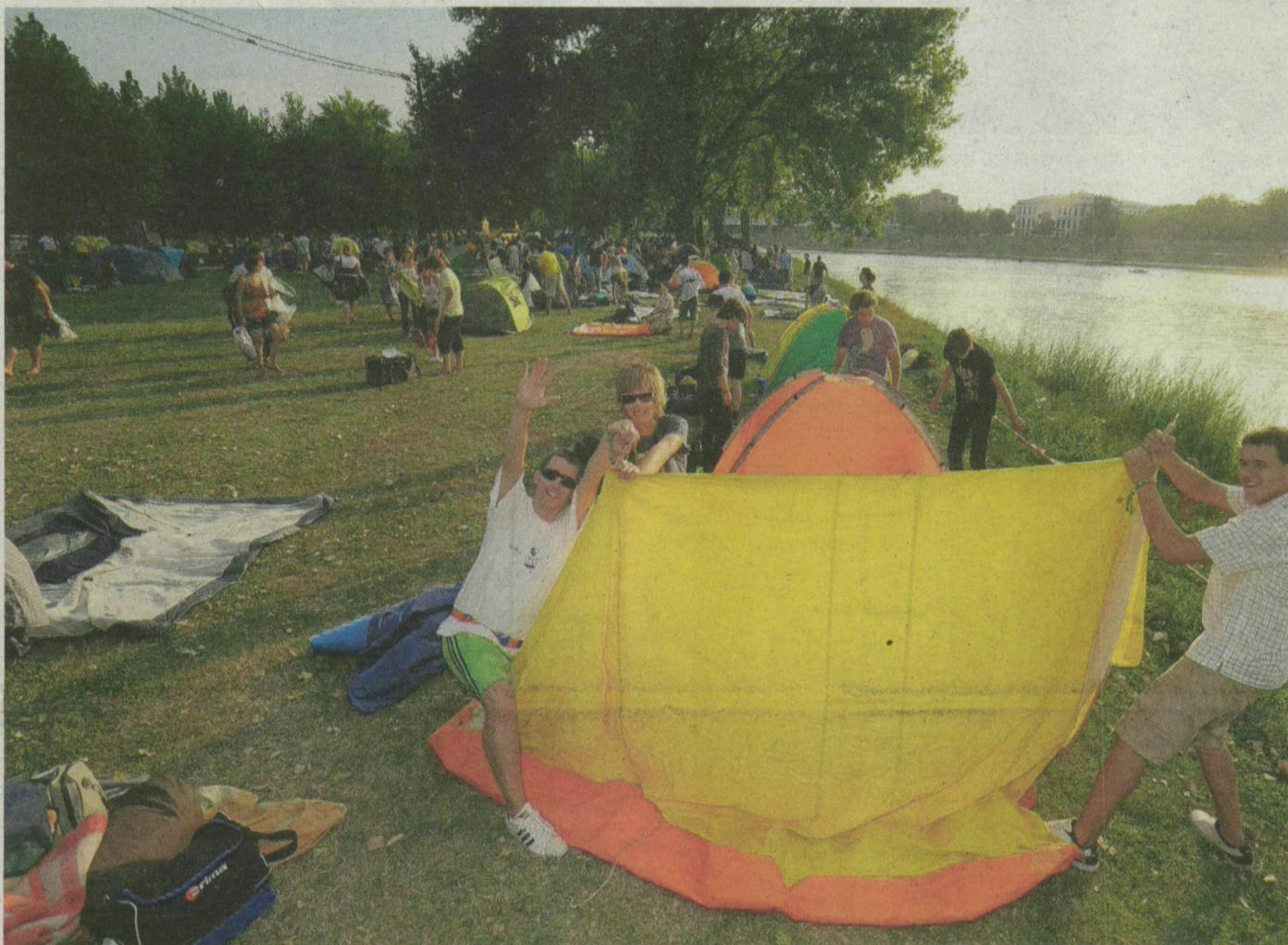
Épül a sátorváros. Ki-ki sajátos módszereket alkalmazott lakhelye felállításához.