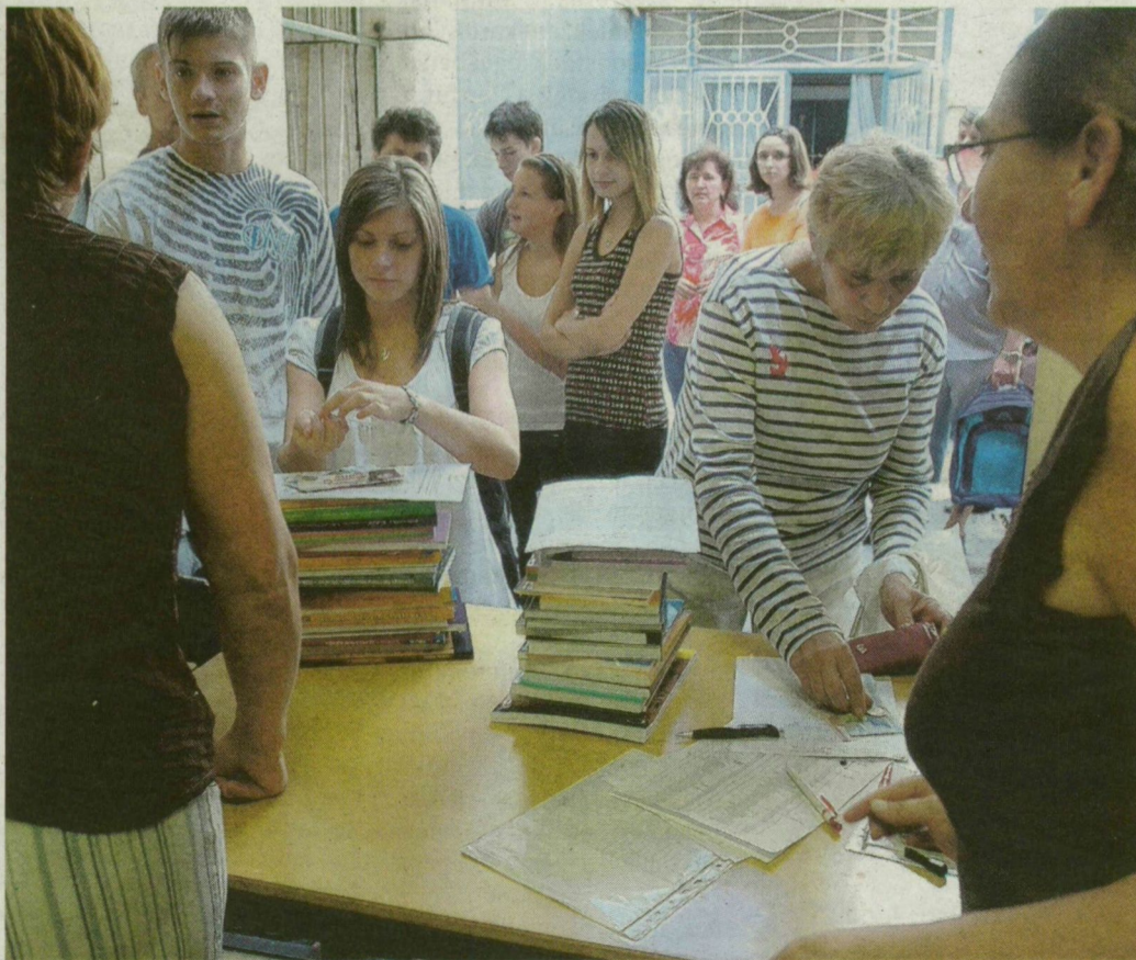
A Deák Ferenc Gimnáziumban is tankönyvekért állnak sorban.

Az 1. osztályos csomag – olvasás, matematika – 8120 forint. Az 5. osztályos csomag – természetismeret, történelem, anyanyelv, matematika, ének-zene – 7480 forint. A 8. osztályos csomag – matematika, történelem, fizika, kémia, biológia, földrajz, ének-zene – 8980 forint. A középiskolások tanrendje jóval összetettebb, ezért a kiadó nem kínál külön csomagokat számukra.