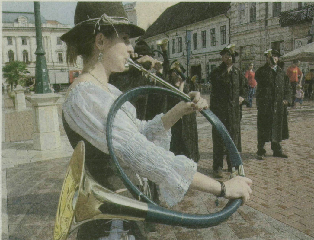
Az idei hungarikumfesztivál tegnap délután a Csongrád megyei vadászkürtösök vidám és vendégcsalogató felvonulásával kezdődött.