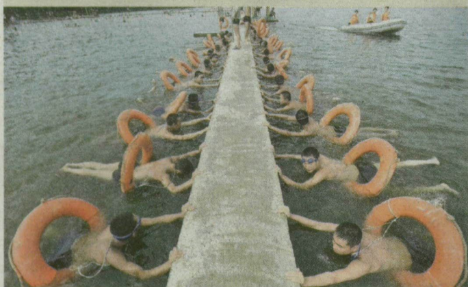
A kínai rendőrség különleges alakulatának tagjai úszni tanulnak a közép-kínai Hupej tartomány Wuhan városában.