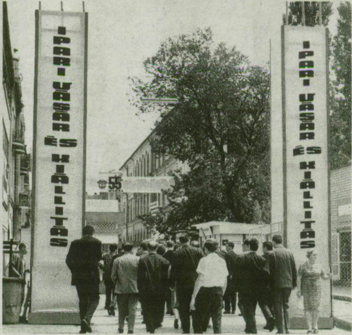
Július 18. Nyit a 24. szegedi ipari vásár.

díjasai: a Csongrád megyei Állatforgalmi és Húsiipari Vállalat, a Hódmezővásárhelyi Divat Kötöttárugyár és a VBKM Világítástechnikai Vállalat.