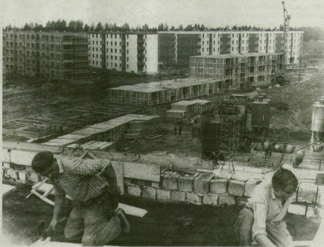
Tarjántelep. Új otthonok nőnek ki a földből.

„A házgýár minden valószínűség szerint egy évvel korábban elkészül, mint azt eredetileg tervezték, és 1971-ben már lakásokat lehet összeszerelni termékeiből. A leendő szegedi házgýárban körülbelül 800 ember talál munkalkalmat.”