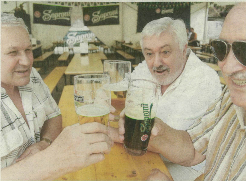
Szőke ciklonok, barna démonok és ártatlan szüzek a sörfesztivál sztárjai. Augusztus 22-éig mindegyiket ki lehet próbálni.