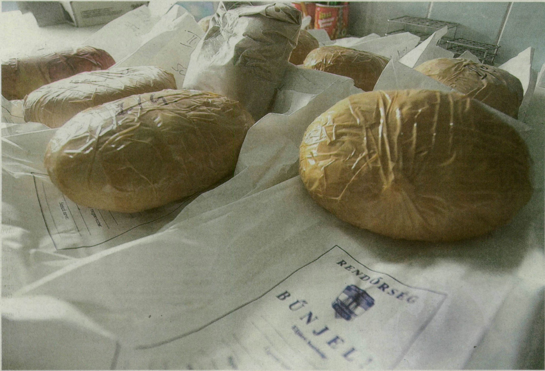
A határon lefoglalt heroin a szegedi droglaborban. Az EU-tagállamok lakóinak kevesebb mint egy százaléka próbálta ki, de a legsúlyosabb kábítószeres esetek fele mégis ehhez a droghoz kapcsolható.

Magyarország sokáig „csak” tranzitútvonal volt a nemzetközi drogkereskedelemben, de mára nálunk is egyre több a fogyasztó. Az ország drogtranzitútvonalán elhelyezkedő két „végpont” megyében, Győr-Moson-Sopronban és Csongrádban érdeklődünk a helyzetről.