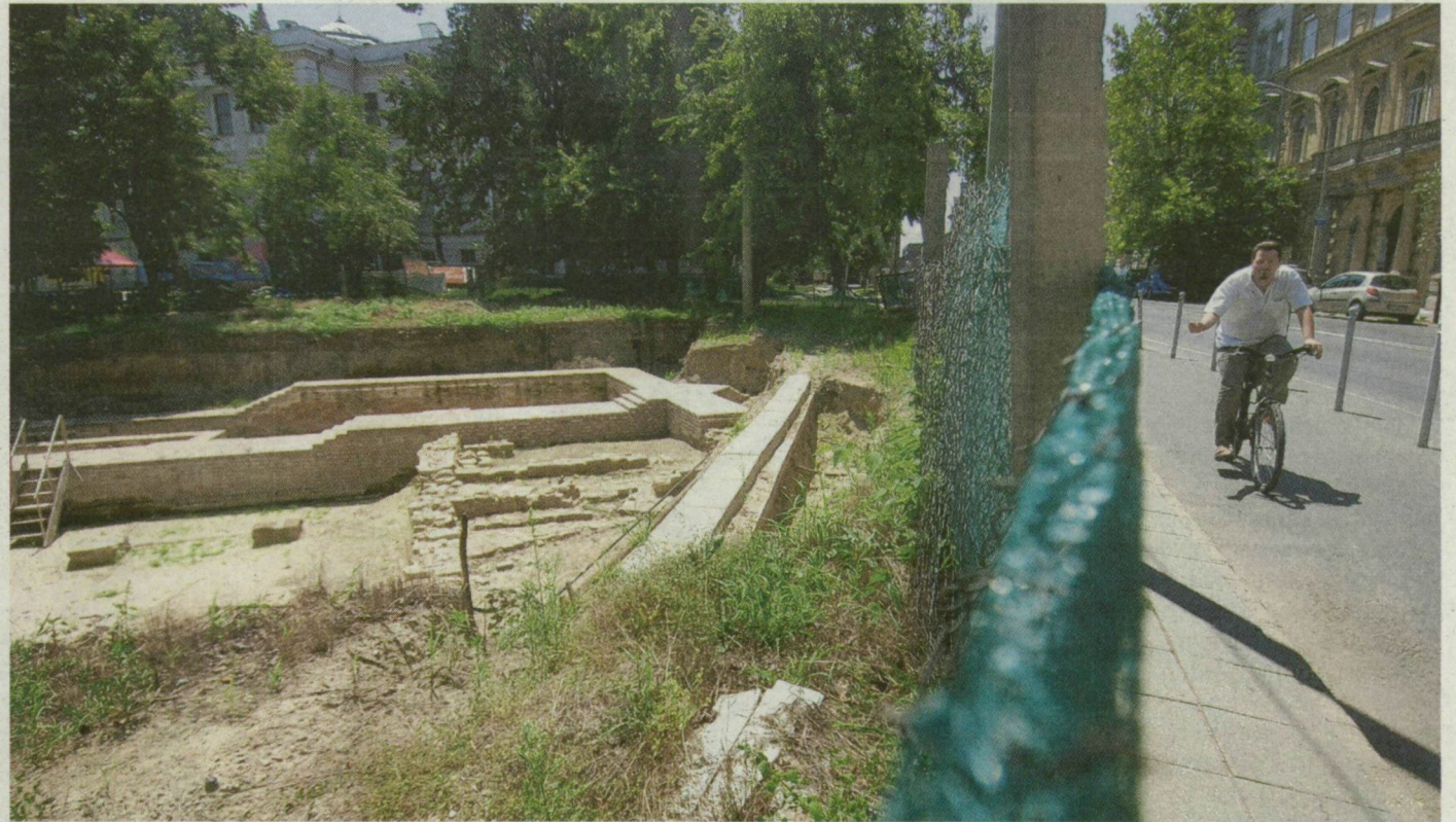
A rissz-rossz kerítés, a gazos ásítási terület kéri a gondozott parkból.

Úgy tűnik, hogy időtlen idők óta, pedig „csak” 10 éve ásnak a régészek a szegedi várnál – helyel-közzel. Azóta tátong ott az hatalmas gödör, amely elzárja a gyalogosok elől az utat.