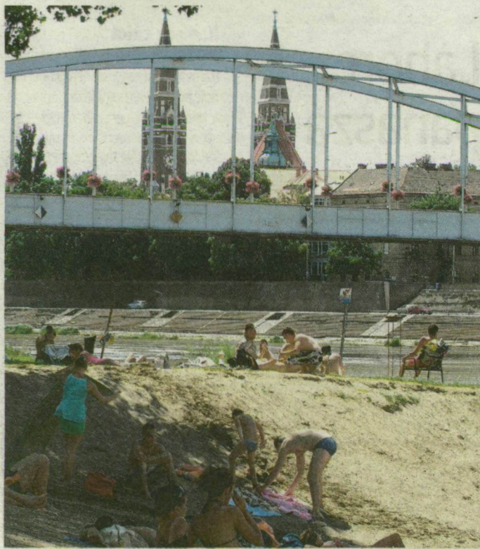
30 millióból alakították ki a szegedi szabad strandot.

CSONGRÁD MEGYE. Tegnap az idei nyár legmelegebb napját élvezhettük. Aki tehetett, a vízparton keresett enyhülést, megtelt a megye hat szabad strandja is.