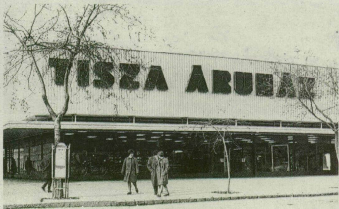
A szegediek kedvence az új üzletközpont.

építőiről. (...) A korszerű üzlet 5 ezer 400 négyzetméteren helyezkedik el, és mintegy 55 millió forint árukészlete van. A legnagyobb forgalmat is képes kielégíteni. Tíz nagy és kilenc önálló osztály biztosítja a vásárlók kiszolgálását. Az áruház vezetősége a bojszolgálaton kívül mintegy tízféle szolgáltatást nyújt vásárlóinak.”