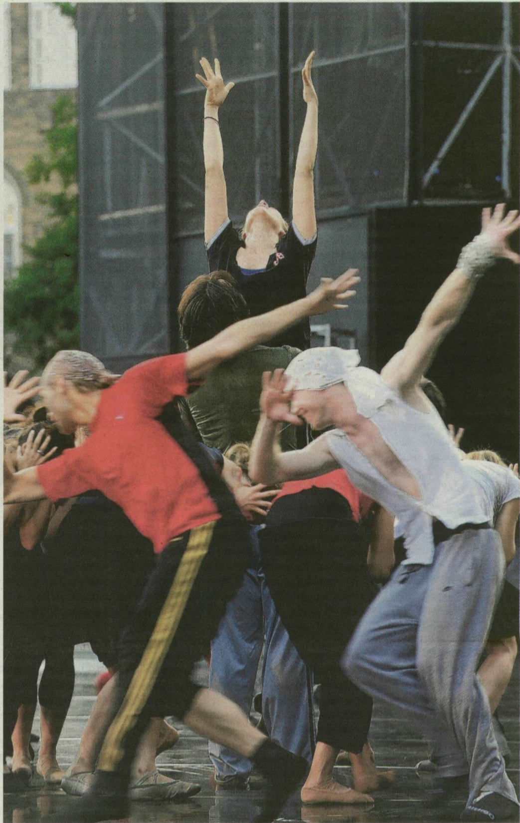
Egyszerű és hatásos színpadképpel készül a Béjart Ballet társulata. A fekete háttér előtt jobban érvényesül a tánc.