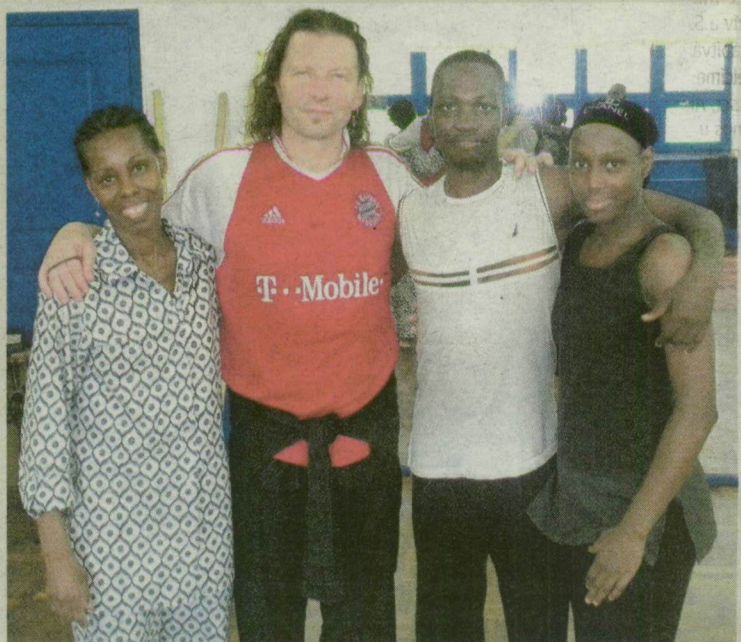
Nyár végére elkészülhet a balettmese a győri balettos koreográfiájával.

– Dehogynem. Sidebe úr a segítőm, aszisztensem, ő tisztázza a jeleneteket, hogy amikor augusztusban ismét megyek, már összeállhasson a balettmese.