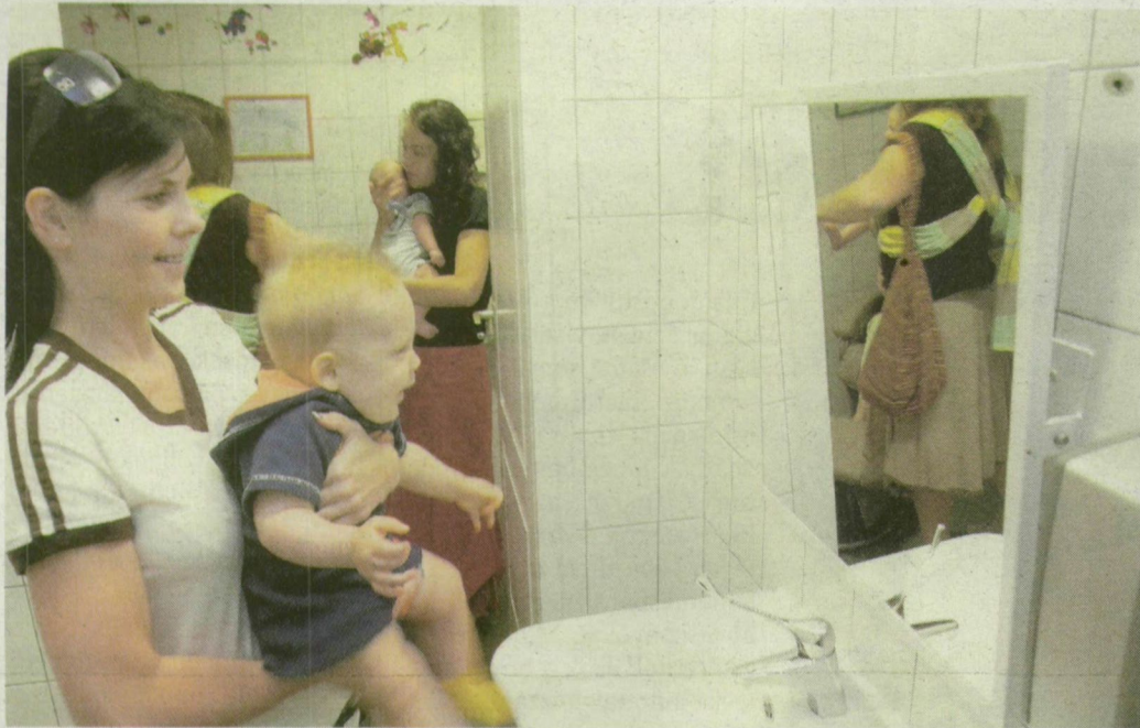
A kisbabáknak és a kismamáknak egyaránt tetszett a TIK új helyisége.