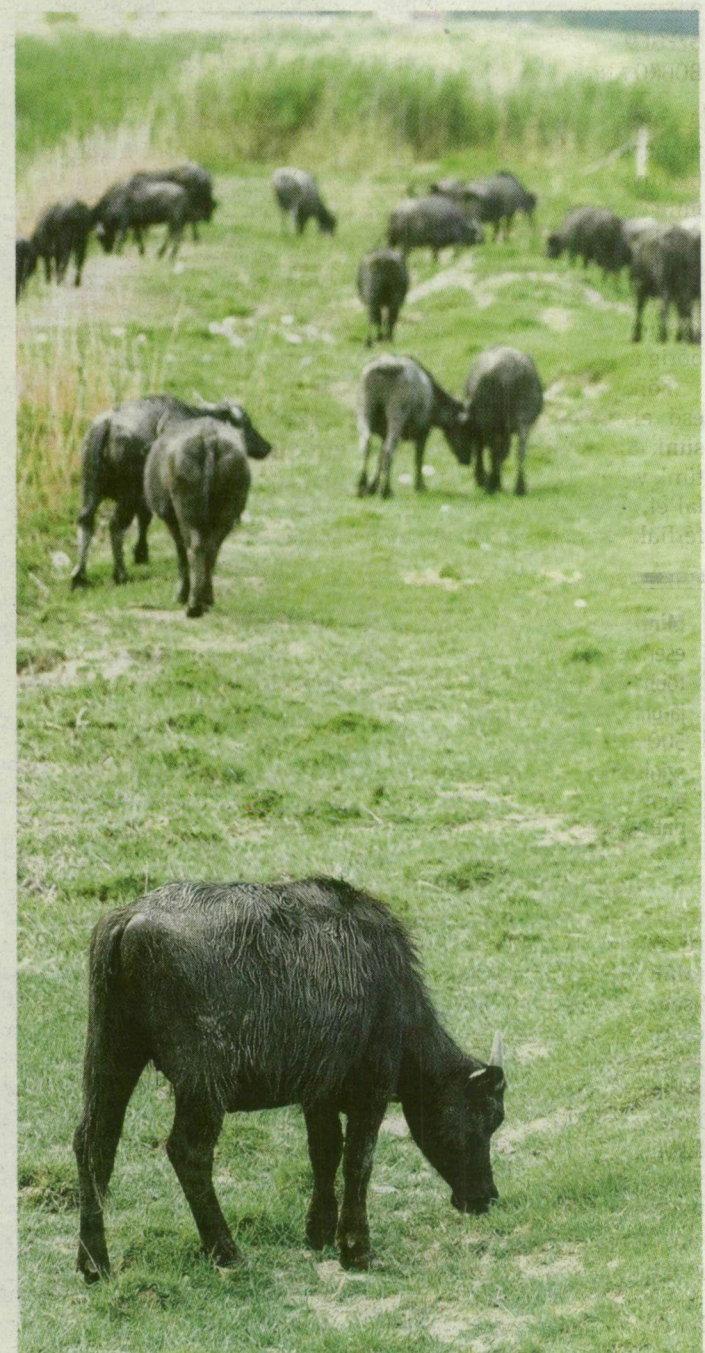
Álló nap legelnek a bivalyok Mórarahalmon – nyomukban megújul az élővilág.

További FOTÓK a témáról az interneten! www.delmagyar.hu