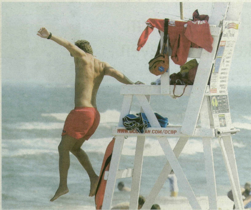
Életmentő ugrás.

quadon ülve, és csónakkal járják a vizet. A sorozatban látott bódében vagy egy magasztított széken csücsülnek nap hosszát. Az állomások között zászlókkal kommunikálnak. Balesetnél először egymástól