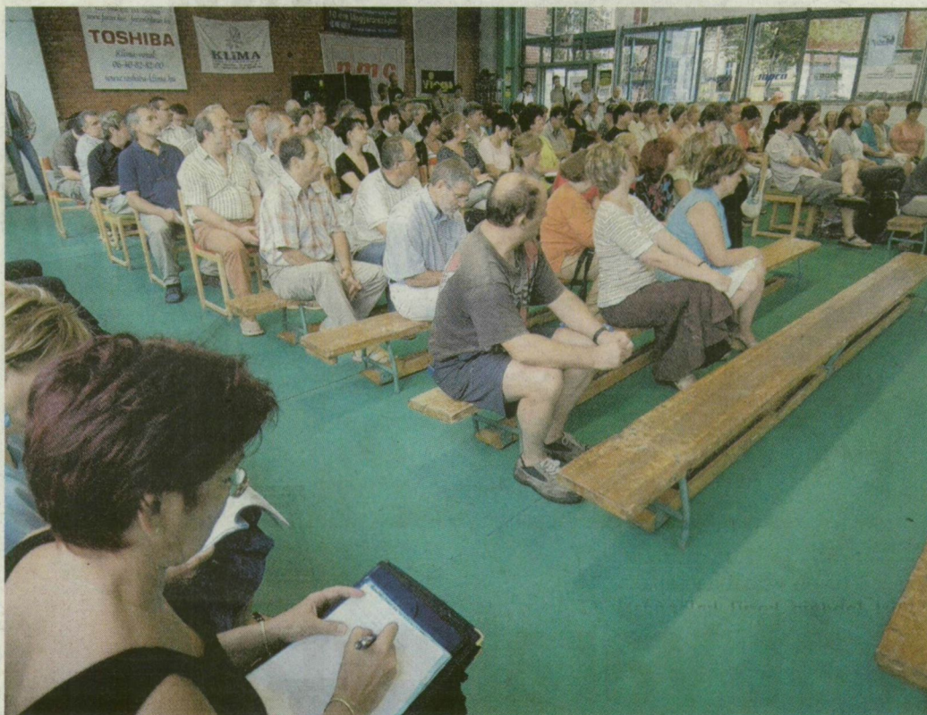
A Tápai- és a Móra-iskola összevont tanári értekezlete 2007-ben.

Közös költségvetése lesz a Csonkának, a Gábor Dénesnek és a Széchenyinek: az első 5 hónapra 268 millió forint – az egész éves büdzsé 900 millió forint lehet. Összesen 189 fős a tantestület: évi 1–2 alkalommal ülnek össze. – 10