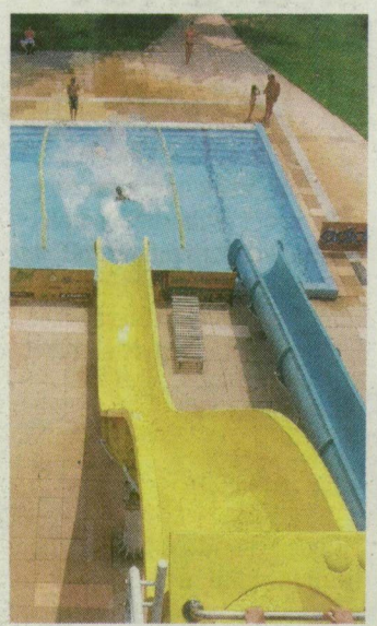
A szentesi strandon tavaly 220 ezren fordultak meg.

Jegyárak. A strandbelépők árát nem lehet összehasonlítani, hiszen egyes fürdők belépőjébe néhány szolgáltatás igénybevételét is beépítették. Egy sima felnőtt napijegy ugyanakkor sehol nem kerül többé 1500 forintnál.