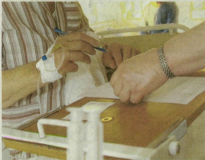
Fontos a pontos adminisztráció.

infektológiai osztály van. A szakember szerint igaz, hogy rosszabb körülmények közt és kevesebb ágyal működik a szegedi osztály, de a régió középpontjában, és megvan a kellő labor- és egyéb vizsgálati háttere is. A döntésüknél inkább ez számított, mint az osztály minősége és az ágyak száma.