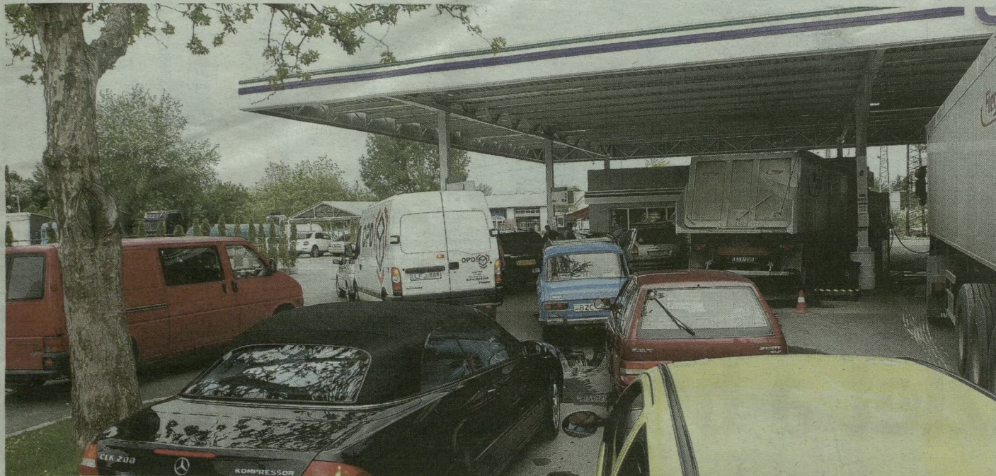
Megdúplázódott a forgalom. A Fonógyári úti benzinkúton sokan akarták teletankolni autójukat.

Csak a legolcsóbb szegedi benzinkútnál volt tumultus tegnap délután, az üzemanyagár-emelés előtti utolsó napon.