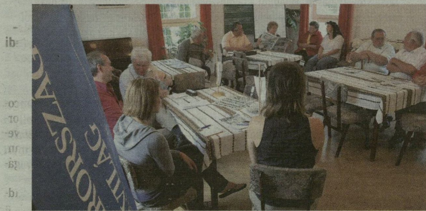
■ CSENGELEI OLVASÓINKKAL A FALUHÁZBAN TALÁLKOZTUNK

→ TESTVÉRTELEPÜLÉSEK. Csegele 1992 óta áll kapcsolatban a németországi Heringgel. Ez a bajor település a festői szépségű Inn folyó partján fekszik. Nemrég kötöttek testvérvárosi megállapodást a lengyel Nowa Słupiąval - a turisták körében népszerű település többek között a Szent Kereszt-hegyről híres.