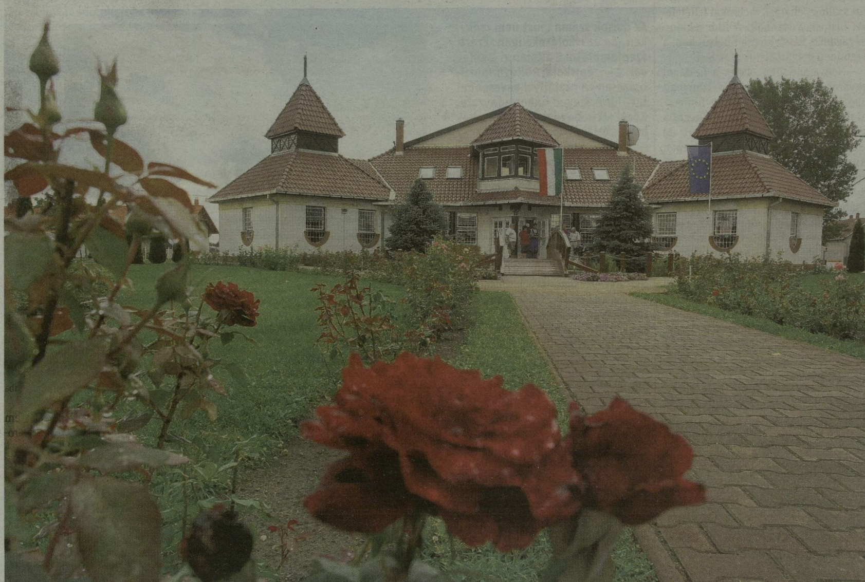
■ CSENGELÉT 8-10 EZER TŐ RÓZSA DÍSZÍTI. VIRÁGOK ÖVEZIK A FALUHÁZAT IS