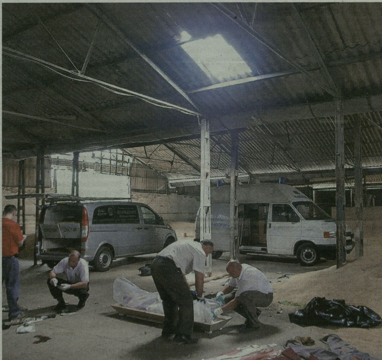
A TERMÉNYTÁROLÓ TETEJÉT AKARTA MEGJAVÍTANI - A BETONRA ESETT