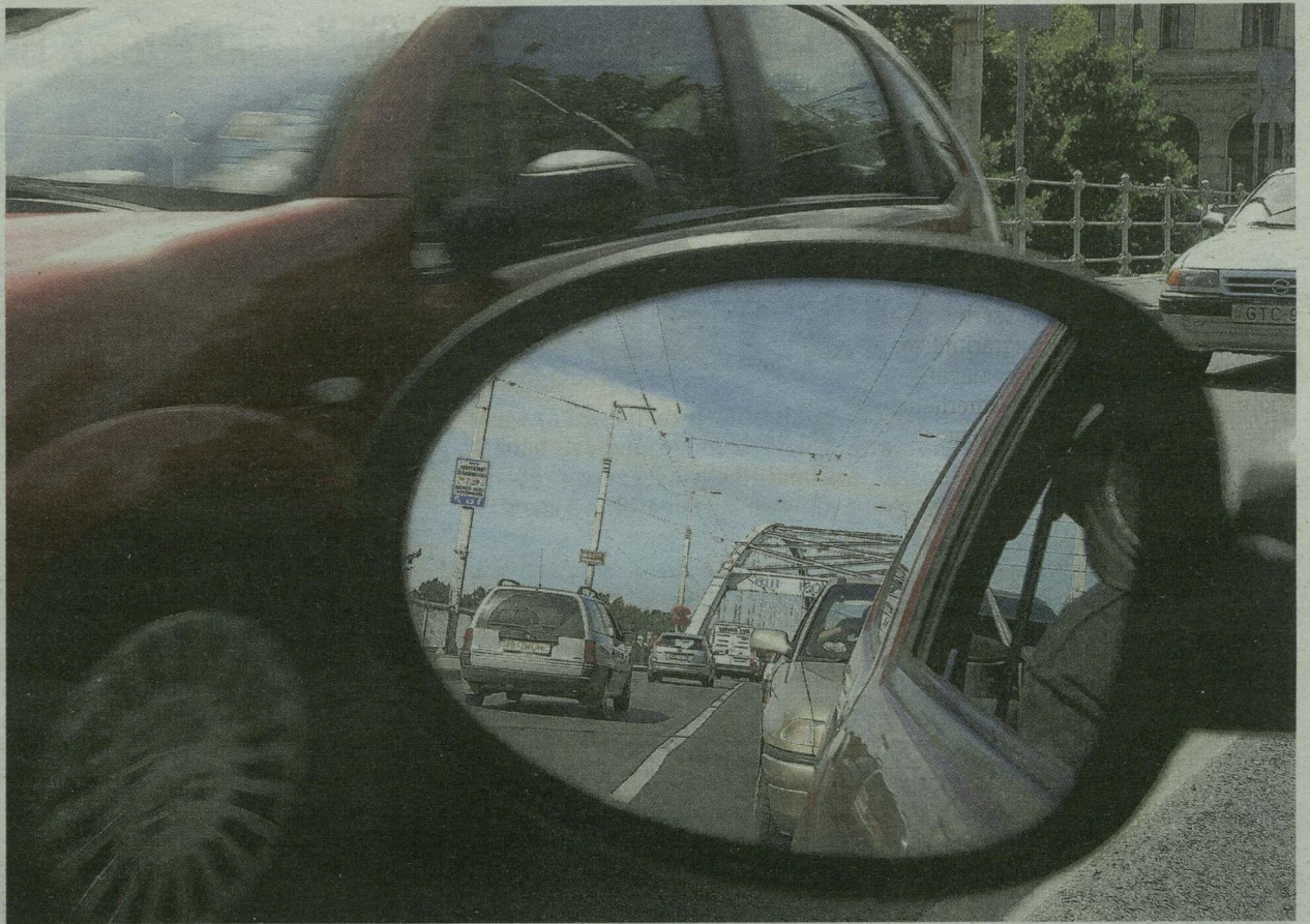
■ NEM LESZ TÜKÖRSIMA AZ ÚT A HÍDON: AUGUSZTUS ELEJÉN TELJESEN LEZÁRJÁK

- A leendő intézmény 200 méteres környezetében két kocsa is van, a Budai Nagy Antal utca pedig forgalmas közút - mondta Juhász Gyula. - A város 135 millió forintot akar ráköltetni a fejlesztésre, ami gondozottként 8,4 millió forint, holott a pályázati kiírásban egy gondozottra maximum 4 millió költhető.