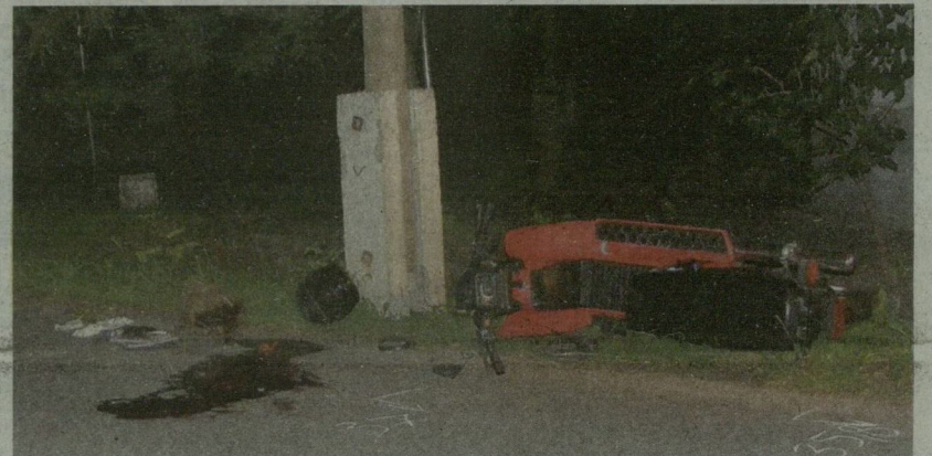
A 31 ÉVES FÉRFI SOK VÉRT VESZÍTETT - ERRŐL ÁRULKODIK A HELYSZÍN