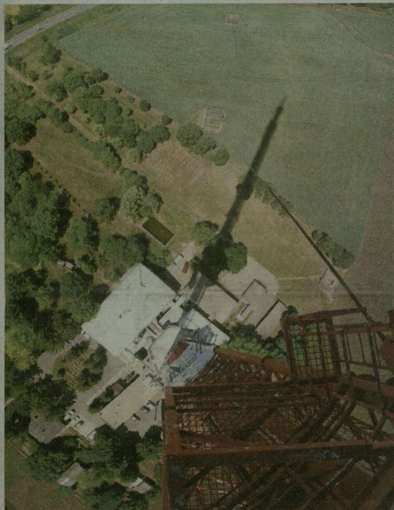
KILÁTÁS 42 EMELET MAGASBÓL: SZÁRAZ IDŐSZAKBAN LEHET IGAZÁN MESSZIRE LÁTNI A SZENTESI TÉVÉTORONYBÓL

Tavaly kicsit összemert, de így is kilométerekről látni a szentesi tévétornyot, amit 50 éve kezdtek építeni. A nagyközönség elől elzárt, 235 méter magas torony megyénk legmagasabb építménye. A csúcsáig nem visz fel a lift, oda már mászni kell. Mi az utolsó kilátóteraszig, 126 méter magasba merészkedtünk, felvonóval közel 4 percig tartott az út.