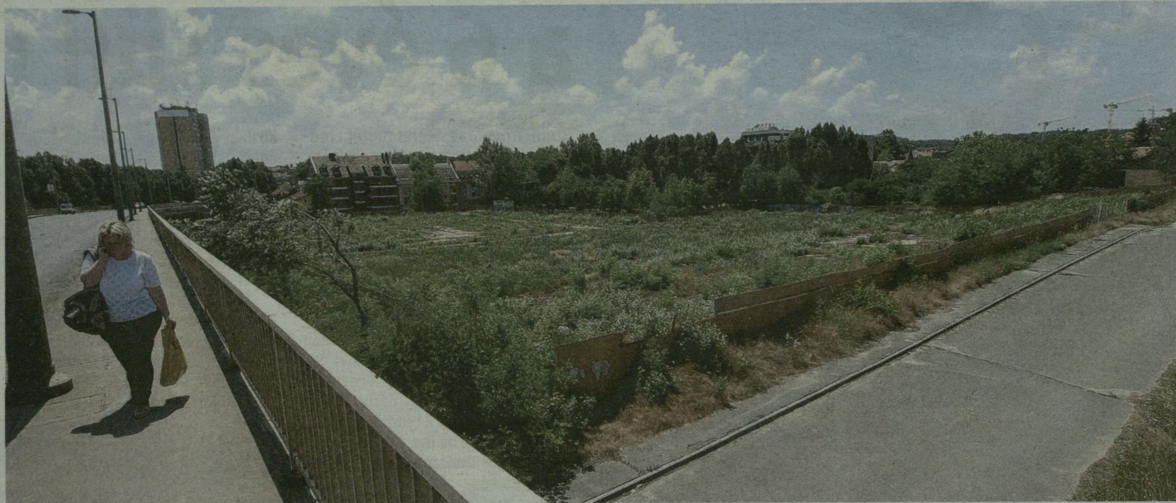
HA A LEENDŐ IRODAHÁZ EGYHARMADÁNAK LESZ BÉRLŐJE, INDUL AZ ÚJSZEGEDI ÉPÍTKEZÉS