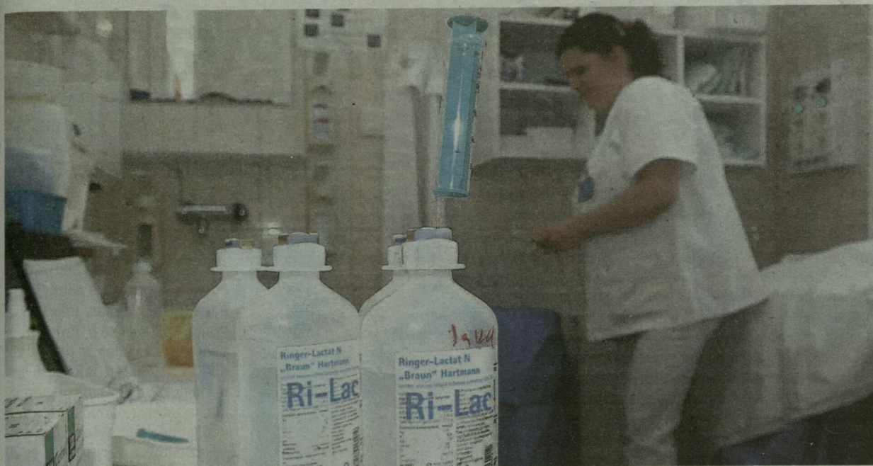
A VITATOTT 45 ÁGYRA A SEBÉSZETNEK ÉS A BELGYÓGYÁSZATNAK VAN SZÜKSÉGE