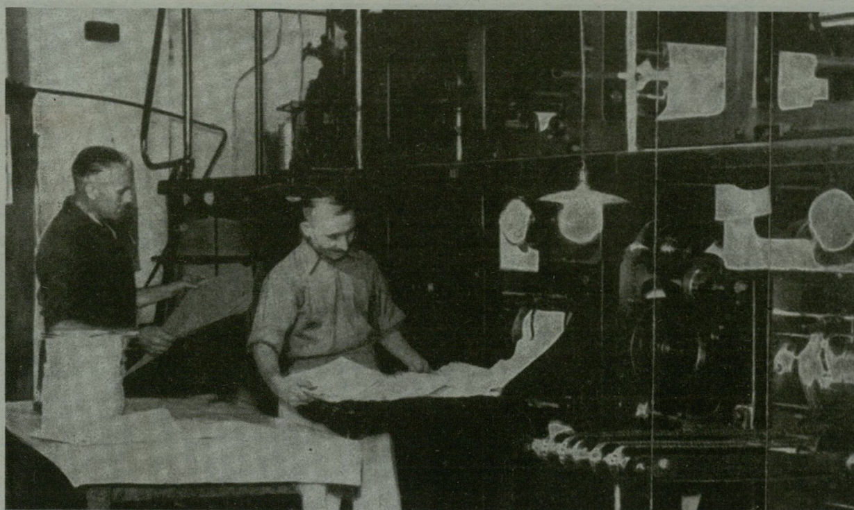
■ Nyomatás: a rotációs gépből már az összehajtogatott, kész újságot adják át a postának